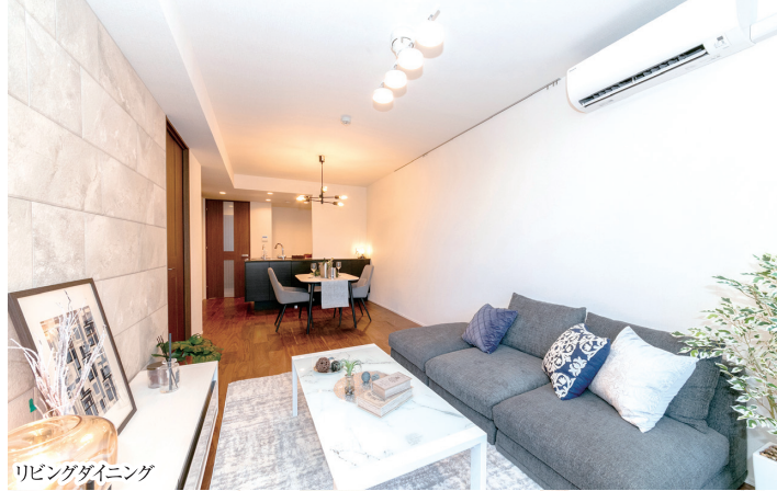
リビングダイニング