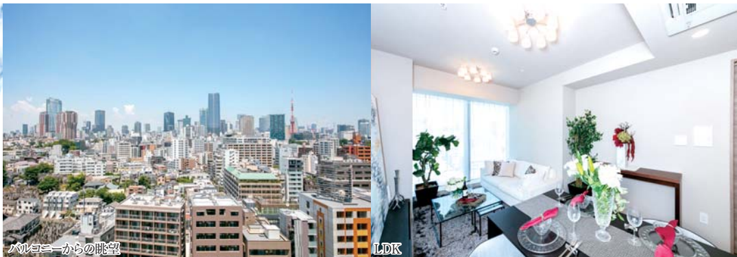
バルコニーからの眺望