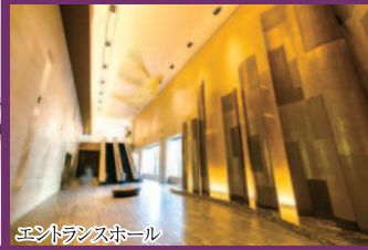
エントランスホール