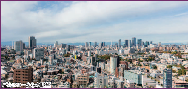
バルコニーからの眺望