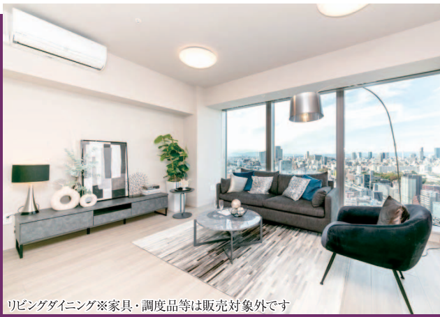
リビングダイニング※家具・調度品等は販売対象外です