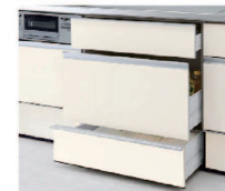
スライドストッカー 3段引出し