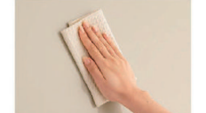
※長くお使いいただくために、やわらかい布でお手入れしてください。

◆お願い ・商品によっては、改良などにより仕様、寸法、カラーなどに多少の変更が生じる場合がございますのでご了承ください。 ・商品写真は印刷のため、現物と若干異なりますので、実際の商品見本をご確認ください。 ・商品写真は参考例です。実際に花瓶や小物等を置かれる場合は、落下等の事故がないように取り扱いにご注意ください。 ・表示価格は、商品代のみメーカー希望小売価格で、取付費・工事費、消費税、セット写真の小物など別途ご負担をお願いいたします。 見積No:1210712-0604 ・掲載内容及び写真・図版の無断転載はたくお断りします。(許可なく転載・流用した場合、損害賠償が発生します。)