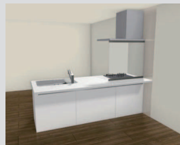
■ シンク ステンレス ステンレス