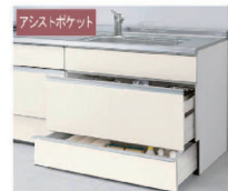
スライドストッカー アシストポケット・シェルフ付