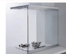
コンロ前全面タイプ(センターキッチン用) BTP85G090