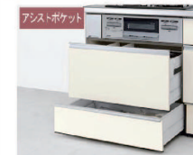
スライドストッカー アシストポケット・シェルフ付