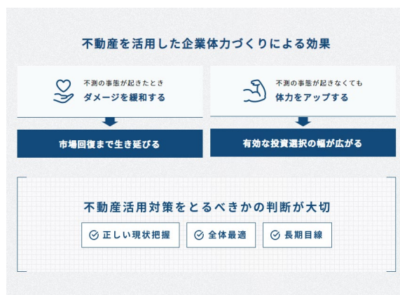
不動産戦略の考え方ページ：不動産戦略の期待効果

その理由について、イラストや図表を用いて分かりやすく解説したページをご用意しました。