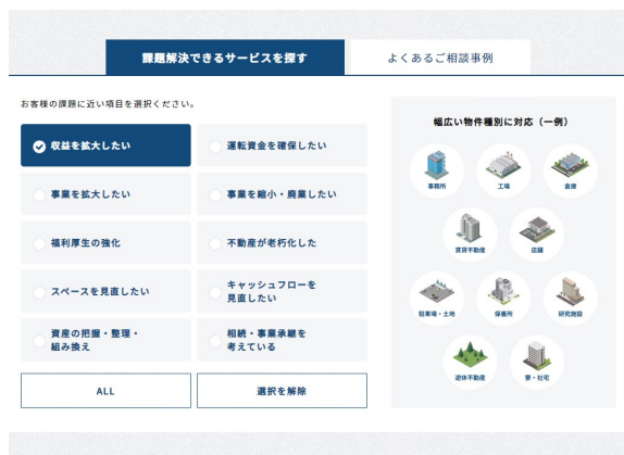
法人不動産にまつわる課題ページ：課題の検索

法人不動産に関するお悩みや課題を抱えているものの、具体的な方向性は定まっていないという段階から活用いただくことで、それぞれの課題に応じた解決策を把握することができます。解決したい課題を大項目から選び、より細分化された項目を選択することで、個別要素に応じた解決策をご提案する仕組みになっています。