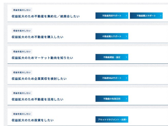
法人不動産にまつわる課題ページ：課題の細分化