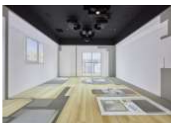
原寸大の室内空間

お客様には、物件説明やVR内覧及び希望条件等についての個別商談を通して比較検討する住戸を選定し、内覧をご予約いただきます。