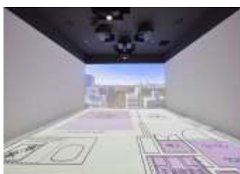
間取図と眺望の合成