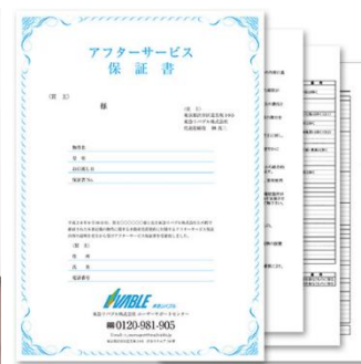
【アフターサービス保証書】