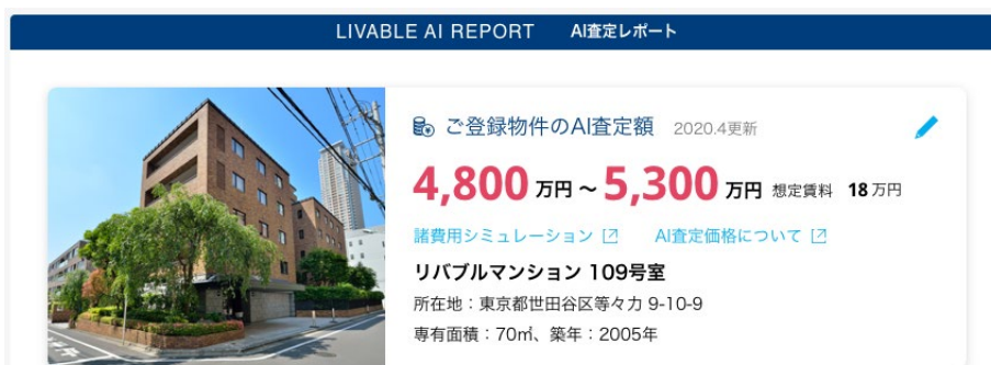
<スピードAI査定結果画面イメージ>

過去10年間で市場に売り出された物件の売り出し価格データ（※2）に、当社の営業担当者が直近1年間で実際に行った査定データを統合してAIが査定価格を算出する当社独自の「AI査定」です。登録（※3）から査定までネット上で簡単に完結できる上、AIが査定に使用するデータは毎週更新されるため、常に最新の査定価格を確認することが可能になります。また、査定結果に加えて、賃貸物件として貸し出した場合の想定賃料も表示されるため、売却だけでなく、所有不動産を貸し出すことも選択肢の一つとしてご検討いただけます。全国の当社営業エリア内のマンションに対応（※4）しておりますので、多くのお客様にご活用いただけます。