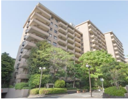
写真：イーストヒルA棟