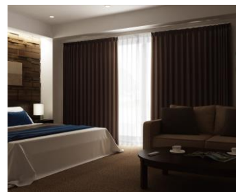
カーテン自動開閉イメージ

外出先からスマートフォンでエアコンや床暖房の起動、お風呂のお湯はり、照明のON・OFF等ができるため、帰宅時間に合わせて快適な室内環境を整えることができます。また、カーテンの自動開閉機能により、起床時間に合わせて自動でカーテンが開き、窓から光が差し込み、心地良い目覚めをサポートします。更には、常設の Bluetooth 付き LED 電球スピーカー（※5）にスマートフォンを接続することにより、クリアな音質で音楽を楽しむことができます。