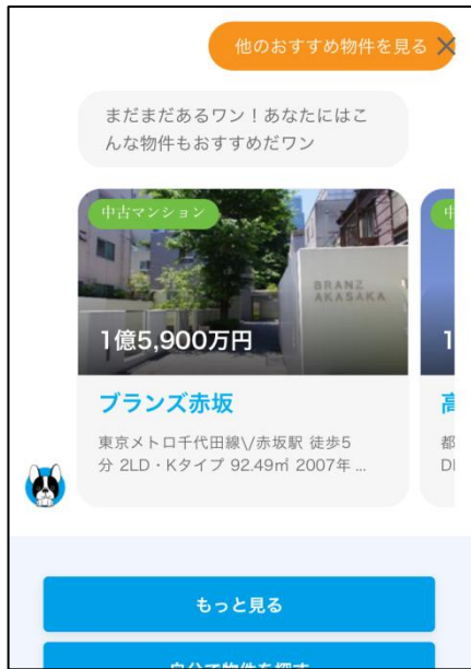
<物件詳細・中古マンションライブラリー (※) ページ>