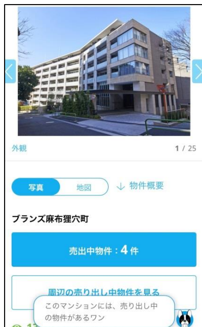
<中古マンションライブラリー (※) ページ>

(3) マンション毎に売出し中の物件の有無を紹介 ※売出し中物件が無い場合は、売出し時に「メールでお知らせする機能」への誘導や、周辺の売出し中物件を紹介