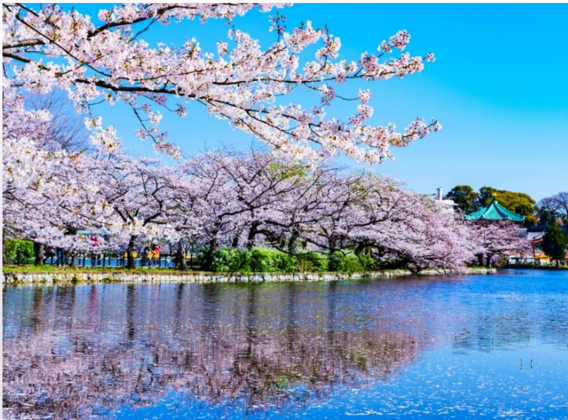
上野恩賜公園（徒歩23分/約1,770m）