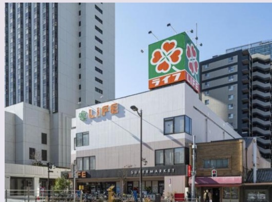
ライフ浅草店 (徒歩9分/約680m)

※掲載の航空写真は、2025年1月に撮影したものにCG加工したもので、実際とは異なります。また、現地の位置を表現した光は建物の規模を示すものではありません。 ※掲載の環境写真は2025年2月に撮影したものです。 ※徒歩分数は80mを1分として算出しています。現地からの距離は地図上の概測です。