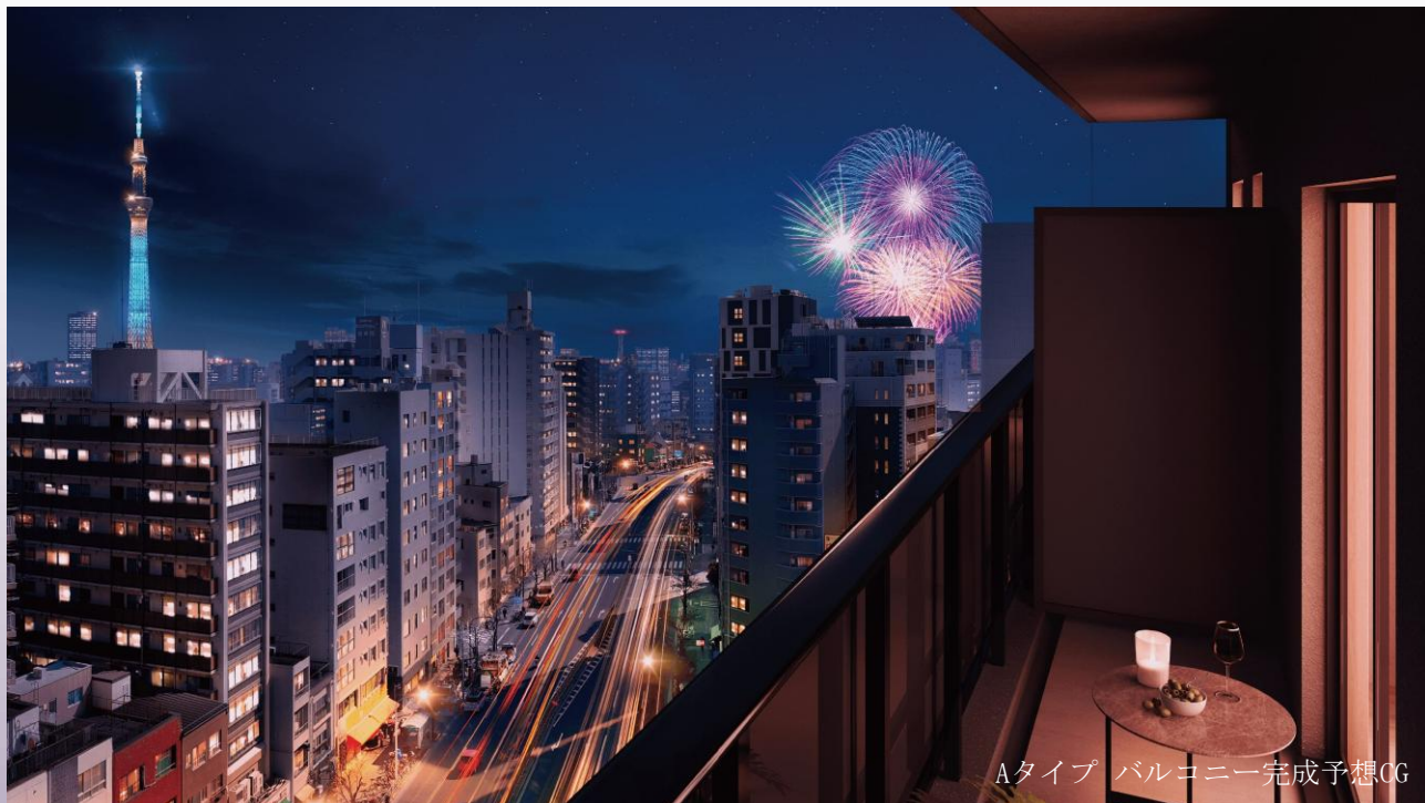
Aタイプ バルコニー完成予想CG