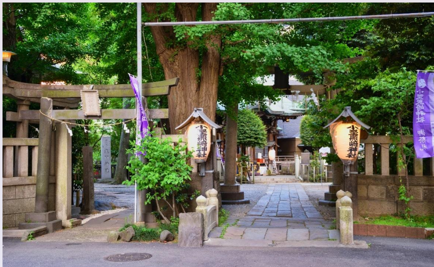
小野照崎神社(徒歩9分/約720m)