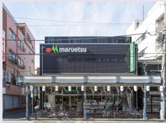
マルエツ 浅草四丁目店 (徒歩7分/約540m)