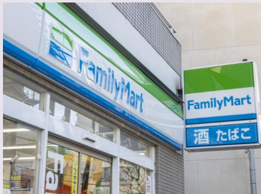
ファミリーマート 千束三丁目 (徒歩1分/約60m)