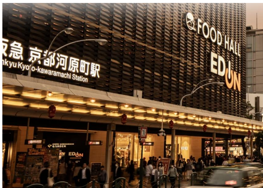
▲阪急京都線「京都河原町」駅（徒歩9分／約720m）

多くの企業や金融機関、商業施設をはじめとする都市機能が集中する京都都心の中心「田の字地区」。都市の景観を守るため、この地区では様々な建築規制がしかれています。中でもプラザ京都河原町通は「31m第1種高度地区」内に位置し、京都中心部において比較的高い建築物の建設が可能。11階建の本物件のような大規模な建築計画を行うことができる限られた場所になります。