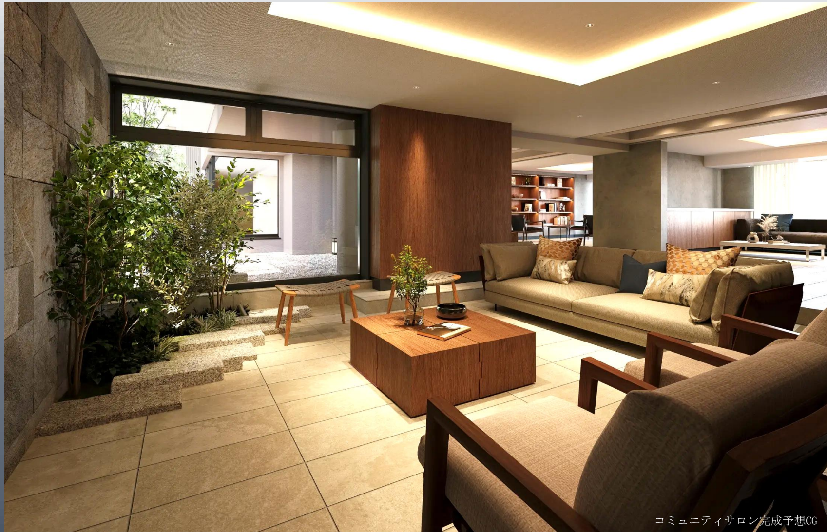
コミュニティサロン完成予想CG