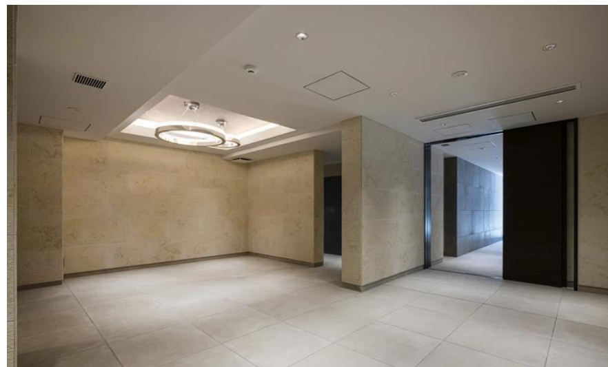
入口大廳（2023年9月拍攝）