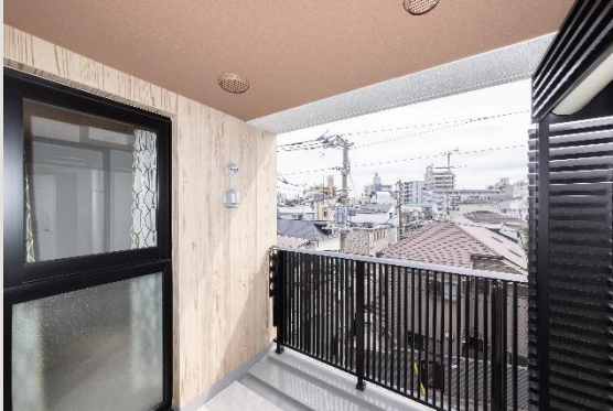
308號房室內照片【2025年6月拍攝】