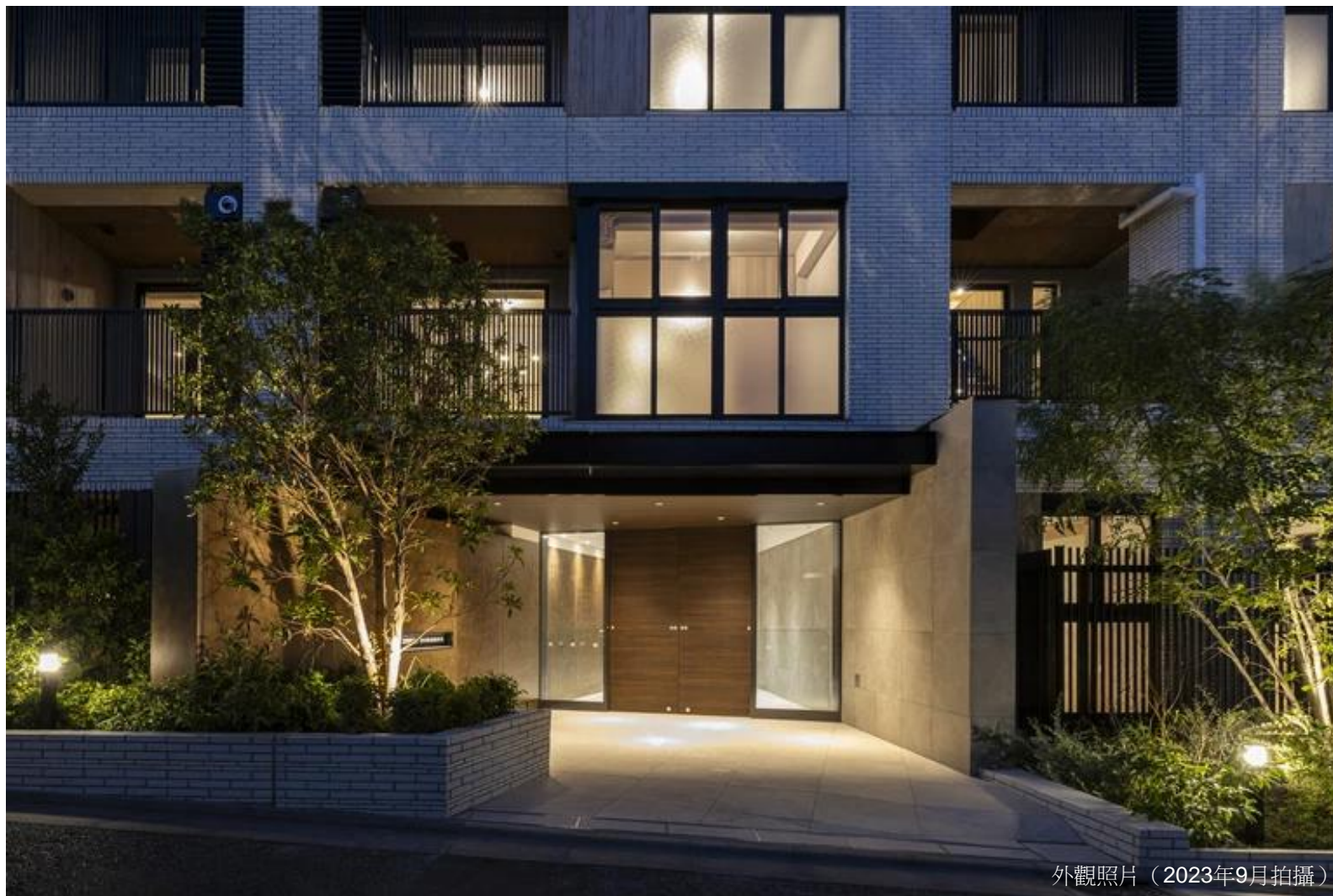
外觀照片（2023年9月拍攝）