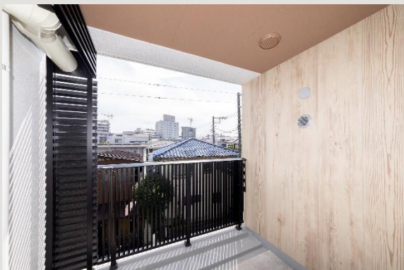
305號房室內照片【2025年6月拍攝】