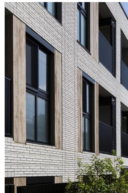
外觀照片（2023年9月拍攝）