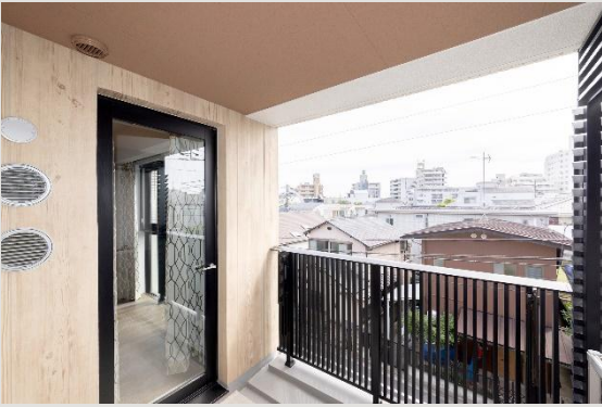
306號房室內照片【2025年6月拍攝】