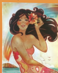
キャット・リーダー 「Welcome to Paradise」