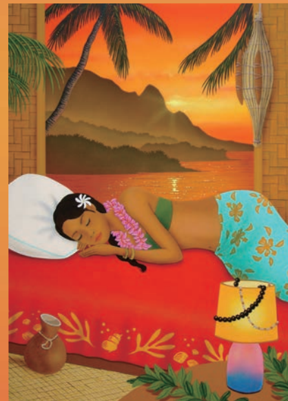
HILO KUME 「Hanalei Sunset」

80年代から「古き良きハワイ」をテーマに写真を撮影。91年ライナでフルムーンに魅せられ、イラストレーターに。ハワイおよび日本で活動中。