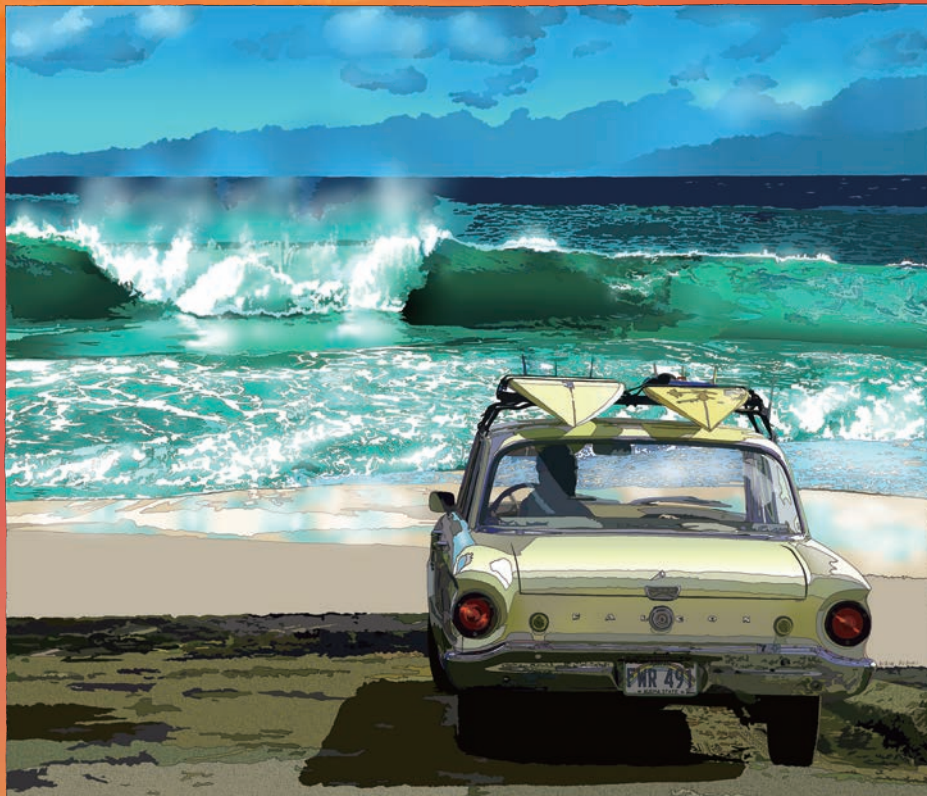
鈴木英人「サンディービーチ」