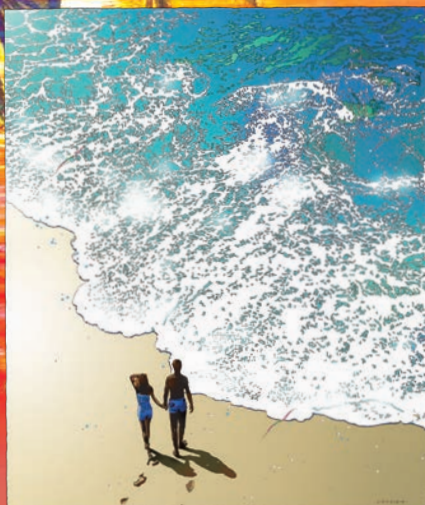
鈴木英人「パラダイス フォー ユー」