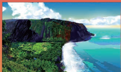
鈴木英人「ピックアップ島の伝説」

山下達郎・TUBEやヒューイルス他多数の印象的なCD、FMSTATION表紙等、光の陰影と透明感溢れる作品で80年代を象徴するイラストレーターに。