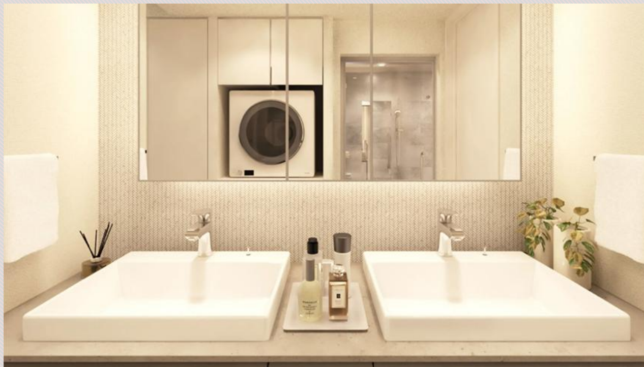
▲I2タイプ 洗面室完成予想図