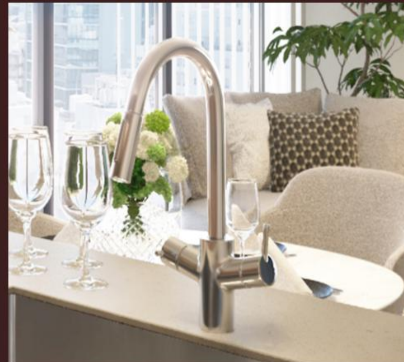
I2タイプ キッチン完成予想図