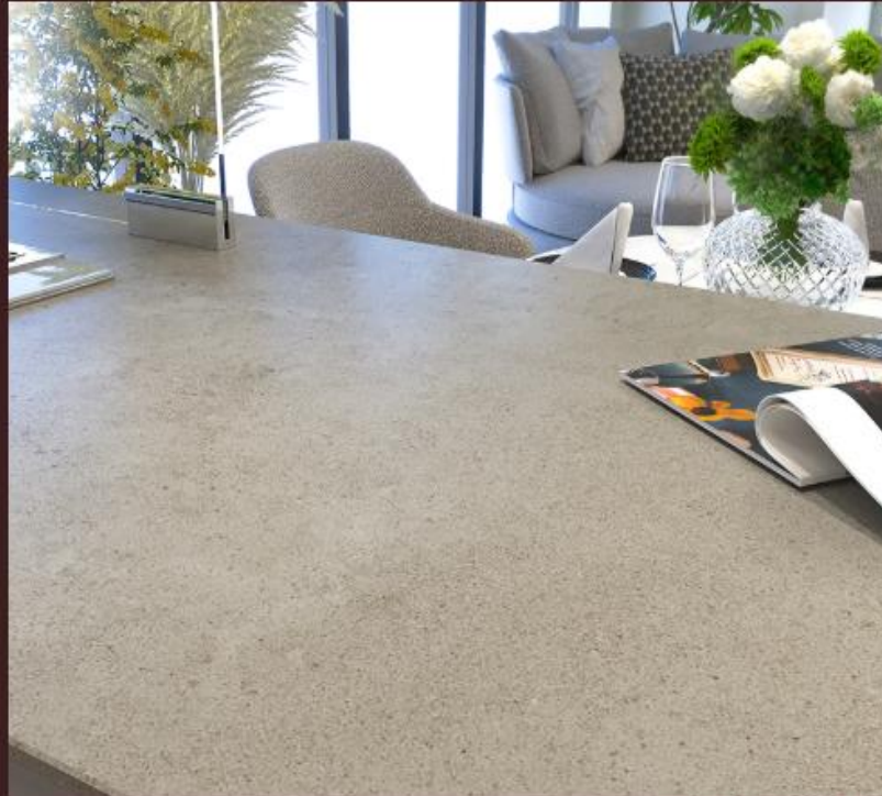
I2タイプ キッチン完成予想図