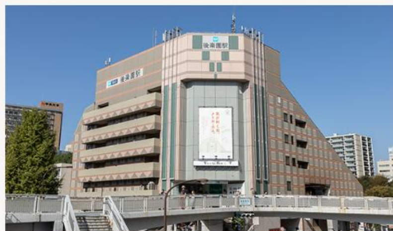
メトロ・エム後楽園 (徒歩5分/400m)