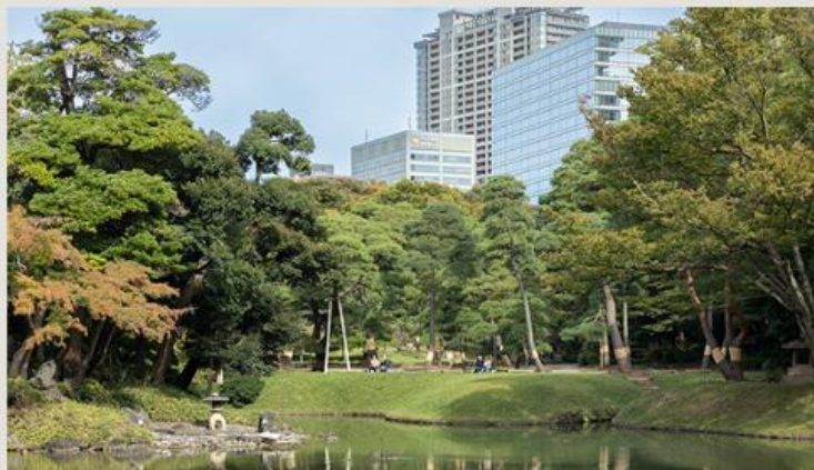
小石川後楽園 (徒歩11分/810m)