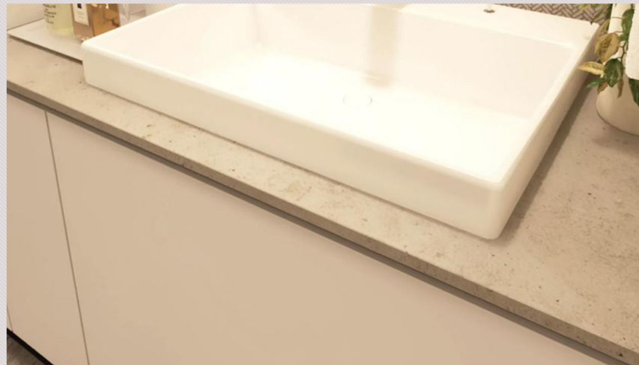
▲I2タイプ 洗面室完成予想図