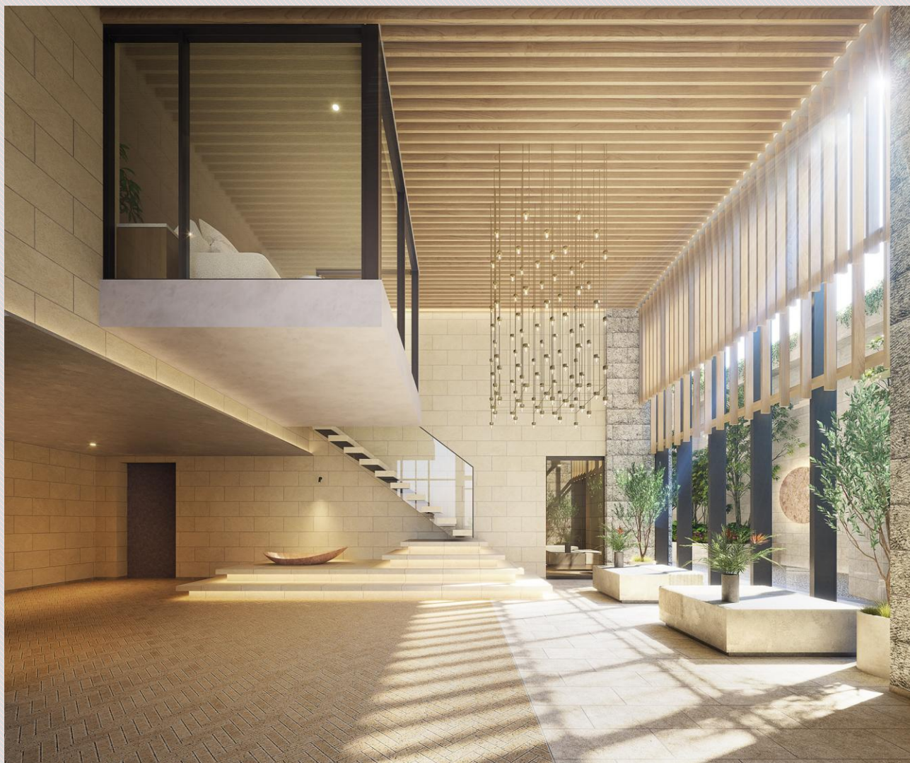
▲エントランスホール完成予想図

2層吹き抜けの開放的な エントランスホール。 伸びやかに広がるエントランスホールは、緑景を望む大開口が明るさと開放感をもたらし、住まう方を優雅にお迎えします。