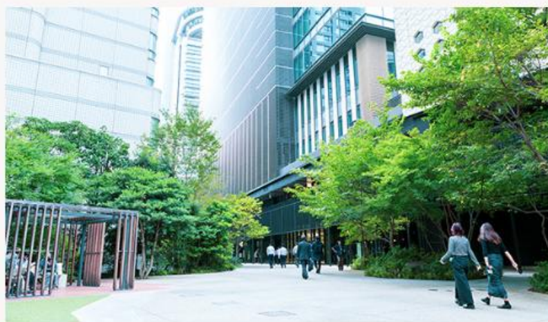
文京ガーデン (徒歩6分/460m)