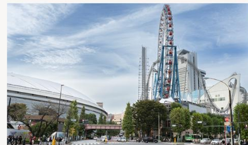
現地周辺の街並み