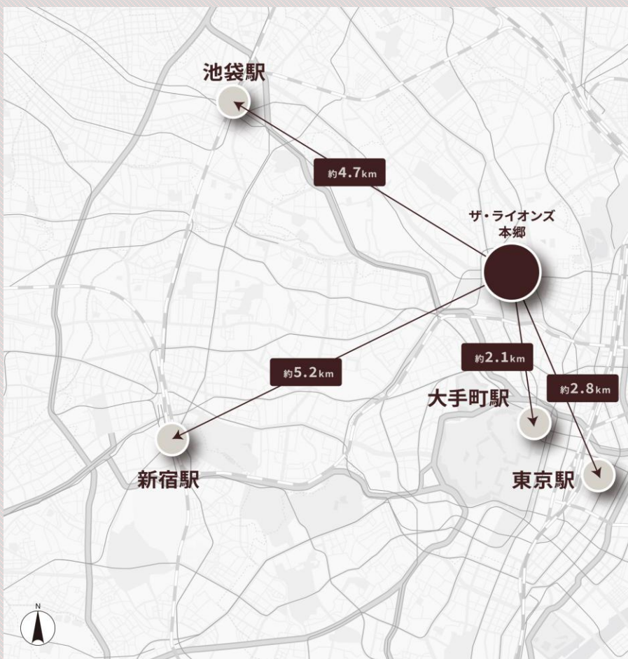
● 現地から上記各駅までの直線距離を示したもので、実際の距離とは異なります。

東京メトロ丸ノ内線・南北線、都営三田線・大江戸線、JR中央・総武線の5路線を利用でき、都心の主要エリアへダイレクトにアクセスできます。