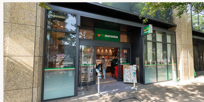
マルエツ 春日駅前店 (徒歩8分/620m)

スーパーなどのショッピング施設から区役所、教育施設、「東京ドームシティ」までが徒歩圏にそろっています。