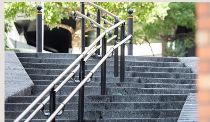
新坂(外記坂) (徒歩1分/20m)