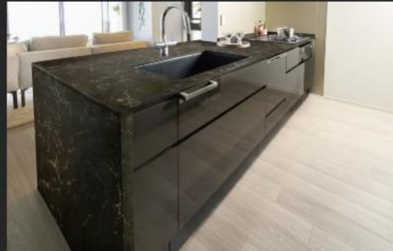
キッチン天板一体型フラットカウンター ダイニングと一体感が生まれるフラットカウンターを採用しています。ダイニング・キッチンを優雅な雰囲気演出します。 ※一部住戸除く。 ※天板には、雑き日が入ります。