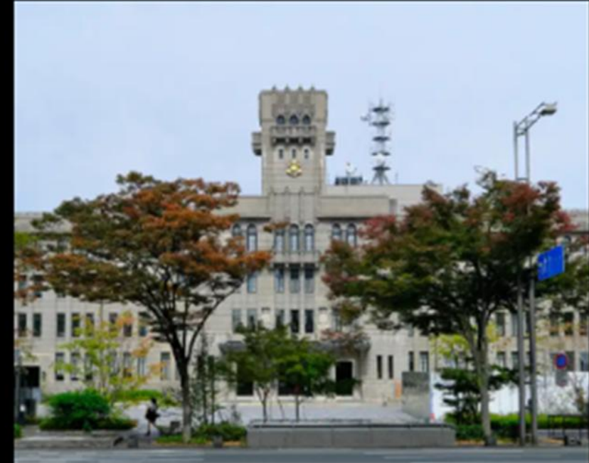
京都市役所(徒歩4分/約260m)