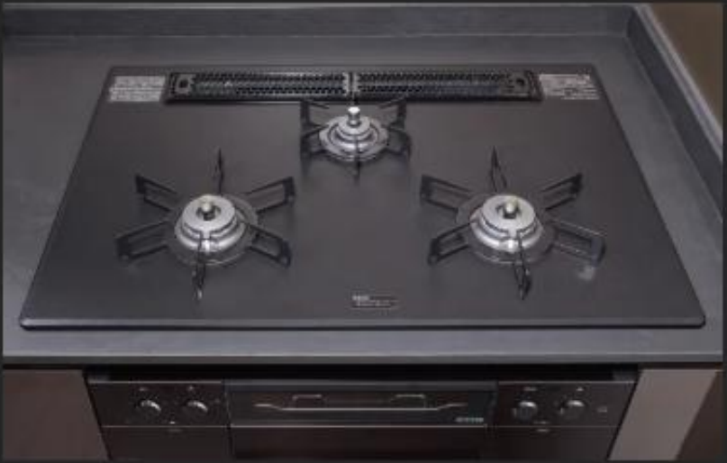
アルミトップ温調機能付セーフティコンロ 凹凸や隙間を少なくし、スッキリとした印象のフラットフェイス。グリル取手もシャープなラインを描き、フェイスと一体化。お手入れがしやすいデザインです。 ※タイプによってサイズが異なります。