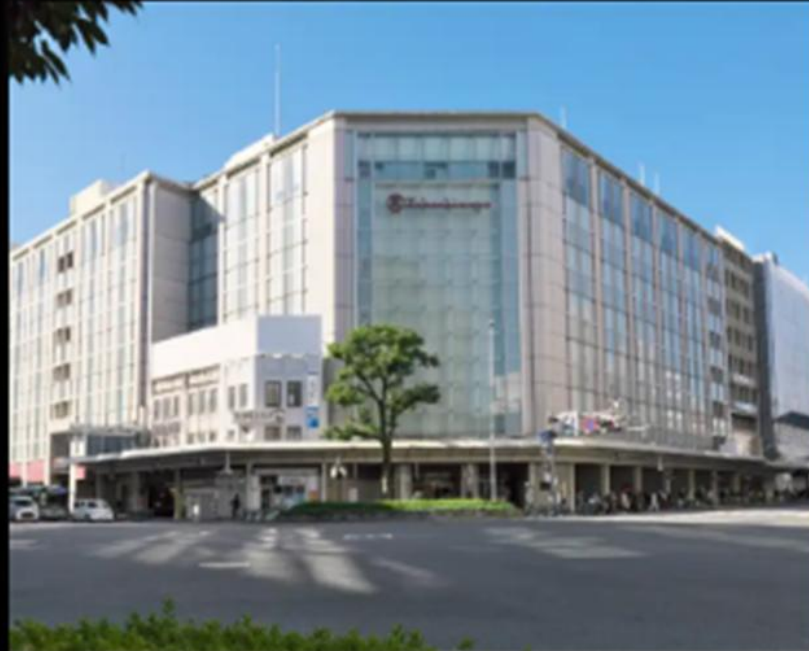
京都タカシマヤ(徒歩12分/約930m)