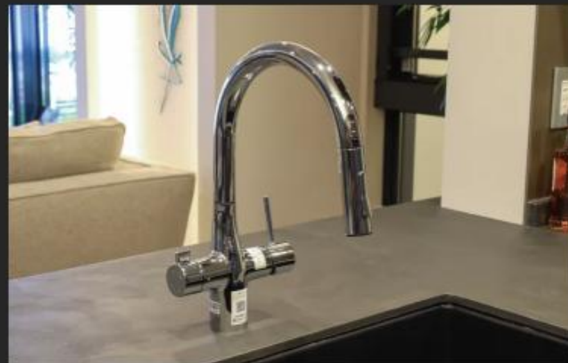
浄水器一体型シャワー付センサー混合水栓 グースネックタイプの水栓を採用。カルキ臭や不純物を取り除く浄水器も標準装備しています。 ※浄水器はカートリッジ交換など、定期的なメンテナンスが必要となります。また、カートリッジ交換費用が別途必要となります。

為提供豐富多樣的生活，我們深入傾聽客戶心聲，以客戶立場思考。同時，持續打造「越住越能滿足心靈、能長久珍愛傳承的居所」。