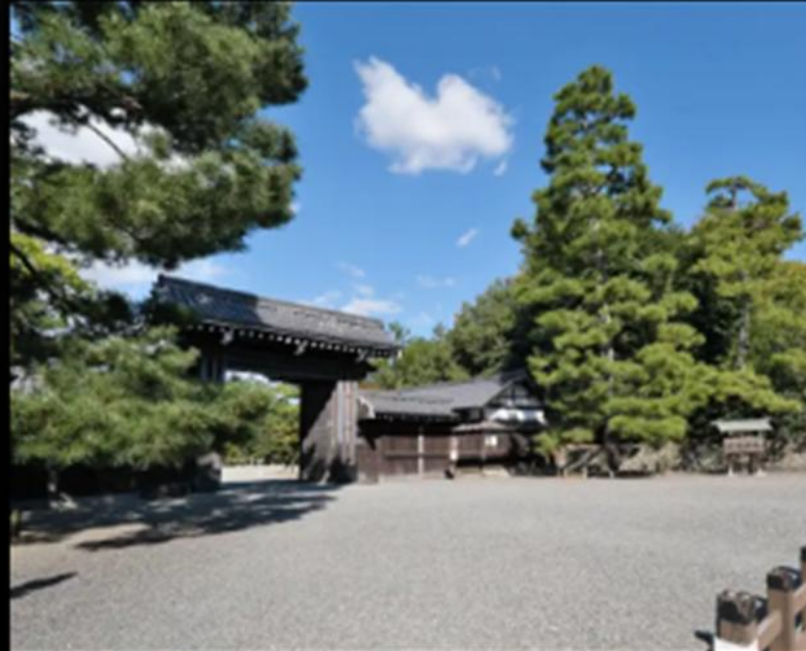
京都御苑(徒歩16分/約1,210m)