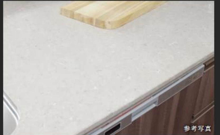
シーザーストーン天板 約90%以上が天然素材のクォーツ（水晶）製。傷や水・汚れに強く、衛生的で高級な質感や美しい色合いが特徴です。 ※天板には、雑き日が入ります。 ※製造上、若干の色柄のバラツキや黒点などが発生することがあります。 ※フロアごとにお選びいただける種類が異なります。