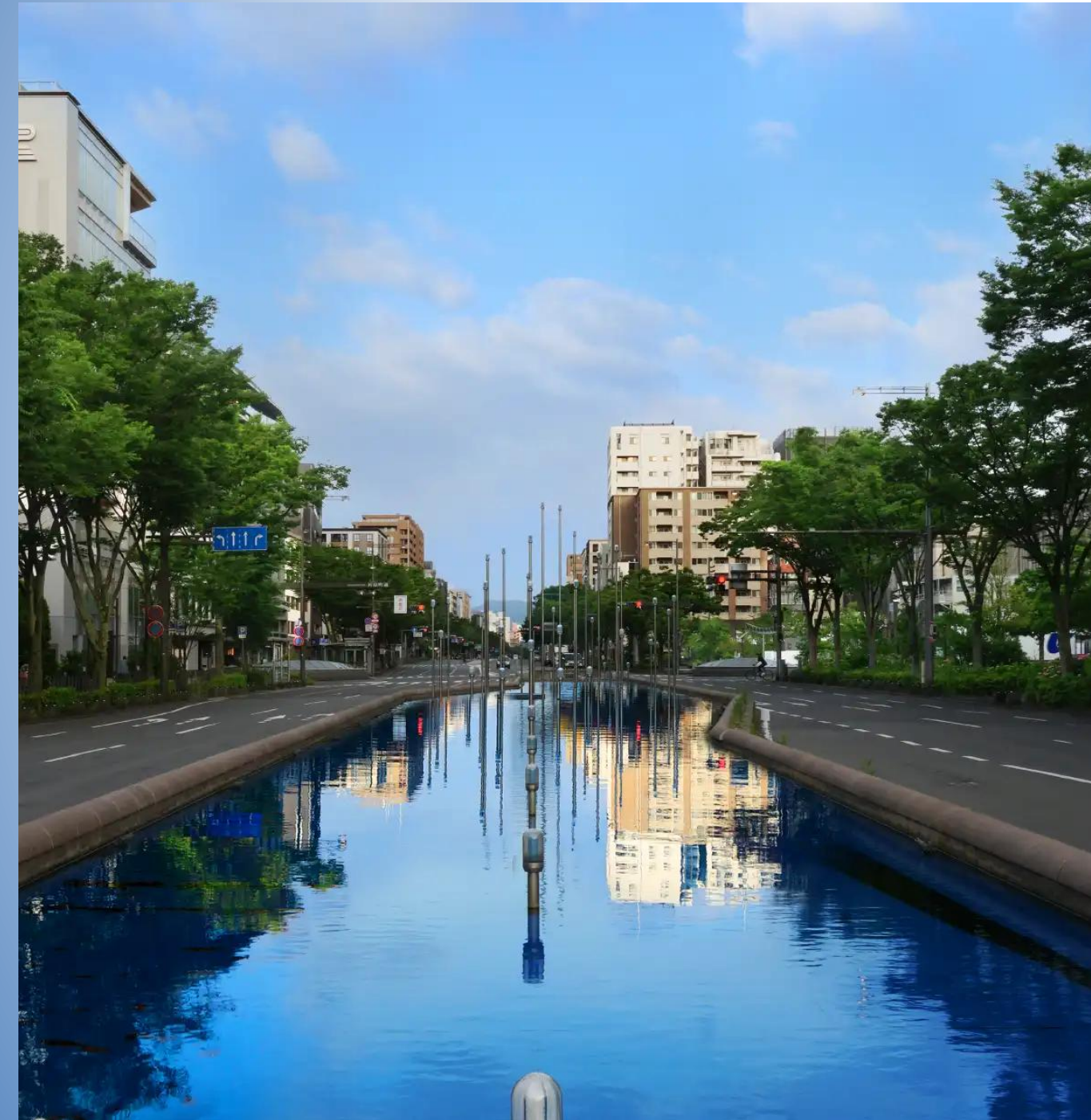
御池通 Island Lake ( 水之浮島 ) ( 步行2分鐘 / 約130m )