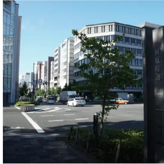
河原町御池路口 ( 步行2分鐘 / 約120m )

京の中心とも言える場所。河原町御池、東入ル。 京都を愛する人にこそふさわしい、自慢の住処です。