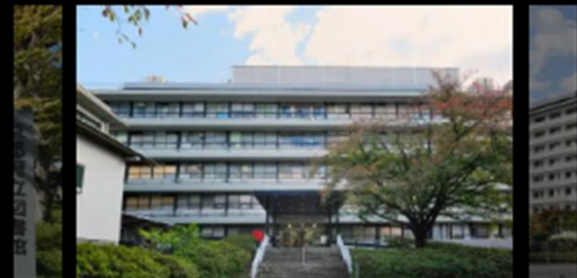
京都新町病院(徒歩22分/約1,740m)