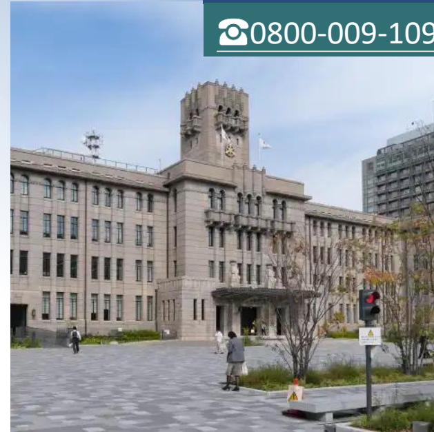
京都市役所 ( 步行4分鐘 / 約260公尺 )