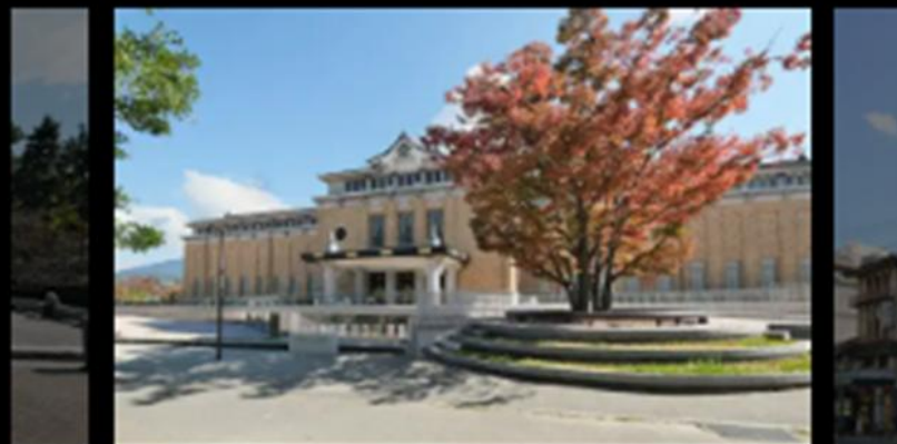
京都市京セラ美術館(徒歩19分/約1,470m)