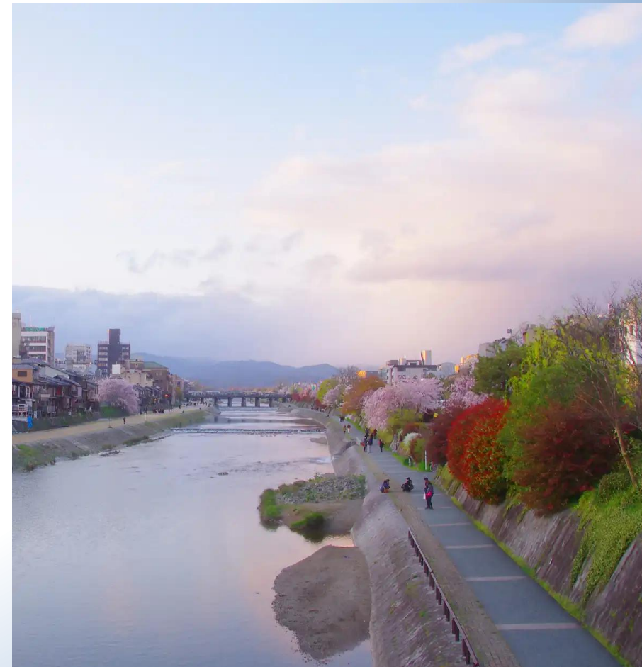
鴨川 ( 步行3分鐘 / 約170公尺 )