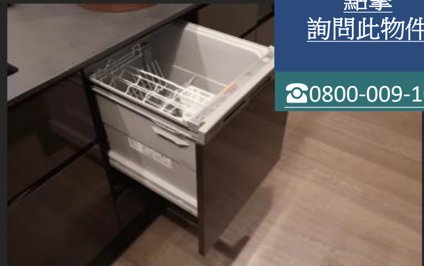
食器洗い乾燥機 食器の出し入れがしやすい引き出し式の食器洗い乾燥機をキッチンに標準装備しています。食後の片付けをサポートします。