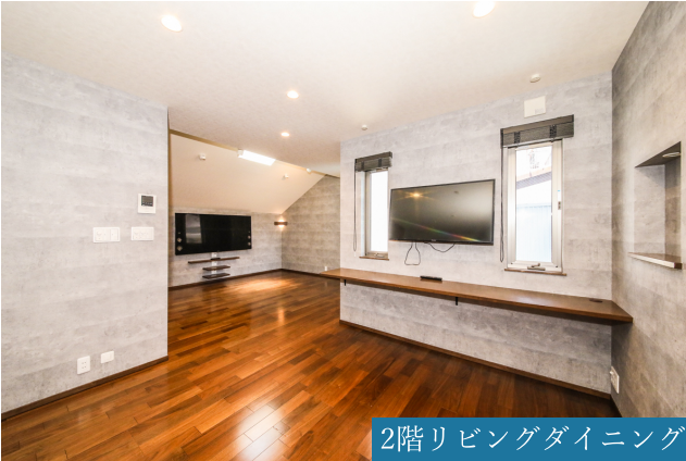
2階リビングダイニング