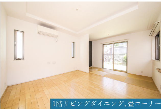
1階リビングダイニング、畳コーナー