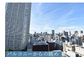
バルコニーからの眺め