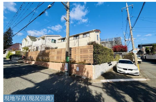
現地写真(現況引渡)