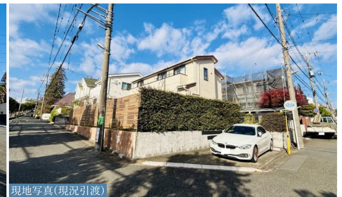
現地写真(現況引渡)