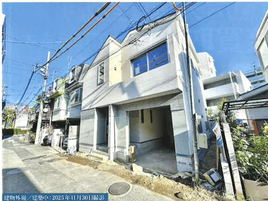
建物外観／建築中：2025年11月30日撮影