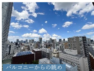
バルコニーからの眺め