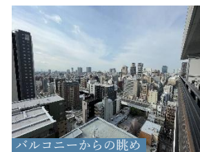
バルコニーからの眺め

【物件番号】 C2725X647 【物件概要】 ●所在地/大阪市中央区松屋町 ●交通 /Osaka Metro 長堀鶴見緑地線「松屋町」駅徒歩2分 ●専有面積 /60.50㎡ ●バルコニー面積 /7.65㎡ ●構造・階数/鉄筋コンクリート造地上20階地下1階建の19階部分 ●築年月 /2015年6月 ●管理形態/全部委託 ●管理員の勤務形態/日勤 ●管理費/月額10,890円 ●修繕積立金/月額8,170円 ●その他費用/ 月額150円 (内訳：自治会費) ●引渡可能年月/相談 ●現況/居住中 ●備考/ 階数については、登記簿謄本所在の階数を記載しております。 専有面積にトランクルーム部分0.48㎡を含む 【取引態様】 媒介 (仲介)