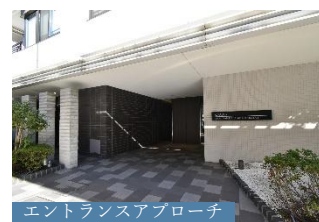
エントランスアプローチ