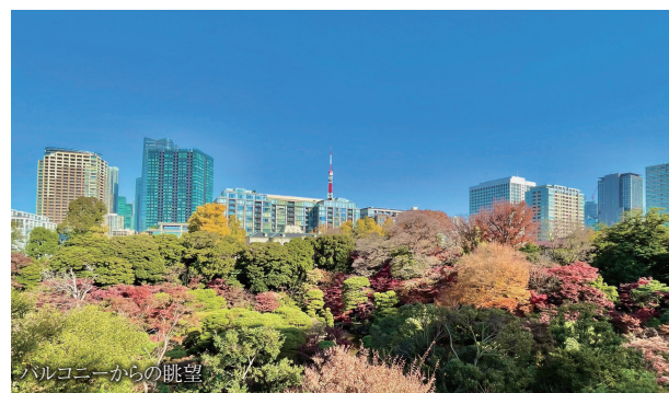
バルコニーからの眺望

【物件概要】●所在／港区三田2丁目●交通／都営地下鉄大江戸線・東京メトロ南北線「麻布十番」駅徒歩8分、都営地下鉄浅草線「三田」駅徒歩11分、JR山手線「田町」駅徒歩12分●専有面積／128.70㎡●バルコニー面積／22.40㎡●構造・階数／鉄骨鉄筋コンクリート造地下2階付19階建の7階部分●建築年月／1971年4月●管理形態／全部委託●管理員勤務形態／日勤管理●管理費／月額55,000円●修繕積立金／月額40,000円●駐車場管理費／月額3,500円●現況／空室●取引態様／媒介(仲介)