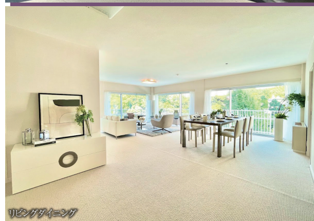
リビングダイニング