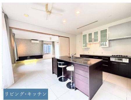
リビング・キッチン