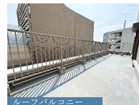
ルーフバルコニー

【物件番号】C27256692 【物件概要】 ●所在地/大阪市中央区玉造2丁目 ●交通/Osaka Metro長堀鶴見緑地線「玉造」駅徒歩2分 ●専有面積/69.91㎡ ●バルコニー面積/14.94㎡ ●構造・階数/鉄骨鉄筋コンクリート造地上14階建の12階部分 ●築年月/2001年8月 ●管理形態/全部委託 ●管理員の勤務形態/日勤 ●管理費/月額17,128円 ●修繕積立金/月額16,079円 ●その他費用/月額200円 (内訳: 理事会活動費) ●引渡可能年月/相談 ●現況/空室 ●備考/修繕積立金は2027年11月分から月額17,128円に改定予定 【取引態様】 媒介(仲介)