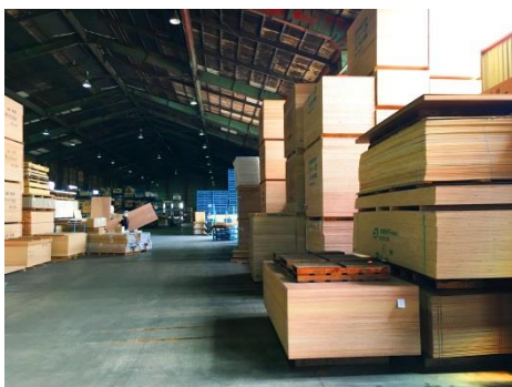
倉庫の一部を『リディアス』専用に確保

この度、資材調達の物流ルートを統一し、効率化とコスト削減を図ります。埼玉県八潮市の倉庫に建築資材の在庫確保をすることにより、工事現場への納期短縮と、オリジナル建材の大量生産による製造コストの削減が見込めます。さらに、建築資材及び設備機器の調達から室内までの搬入を一元管理することで、工事業者の人的コストも抑えることができます。