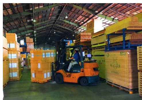
在庫、発注、仕分け、発送、搬入を一元管理

物流ルートを統一し、効率化による量産体制とコスト削減により、今年度の『Lideas』の販売戸数を200戸超まで見込み、さらに拡大を図ってまいります。